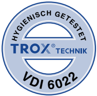
Konform nach VDI 6022