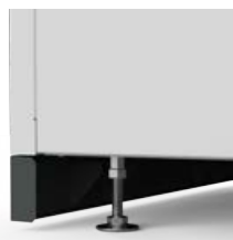
Justierfuß und Sockelleiste