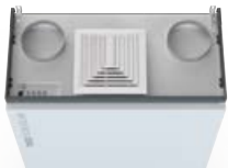
Anschluss Außen- und Fortluft