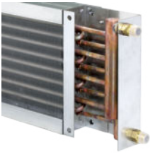
Wärmeübertrager mit Kupferrohren und Aluminiumlamellen